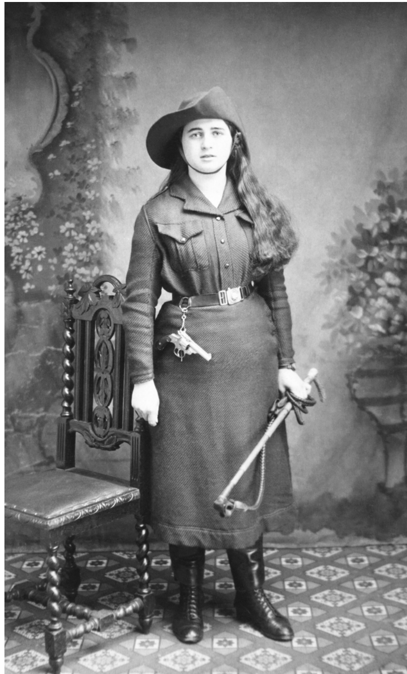
Mujer vestida de domadora Anónima. Maidstone, Inglaterra. 1915