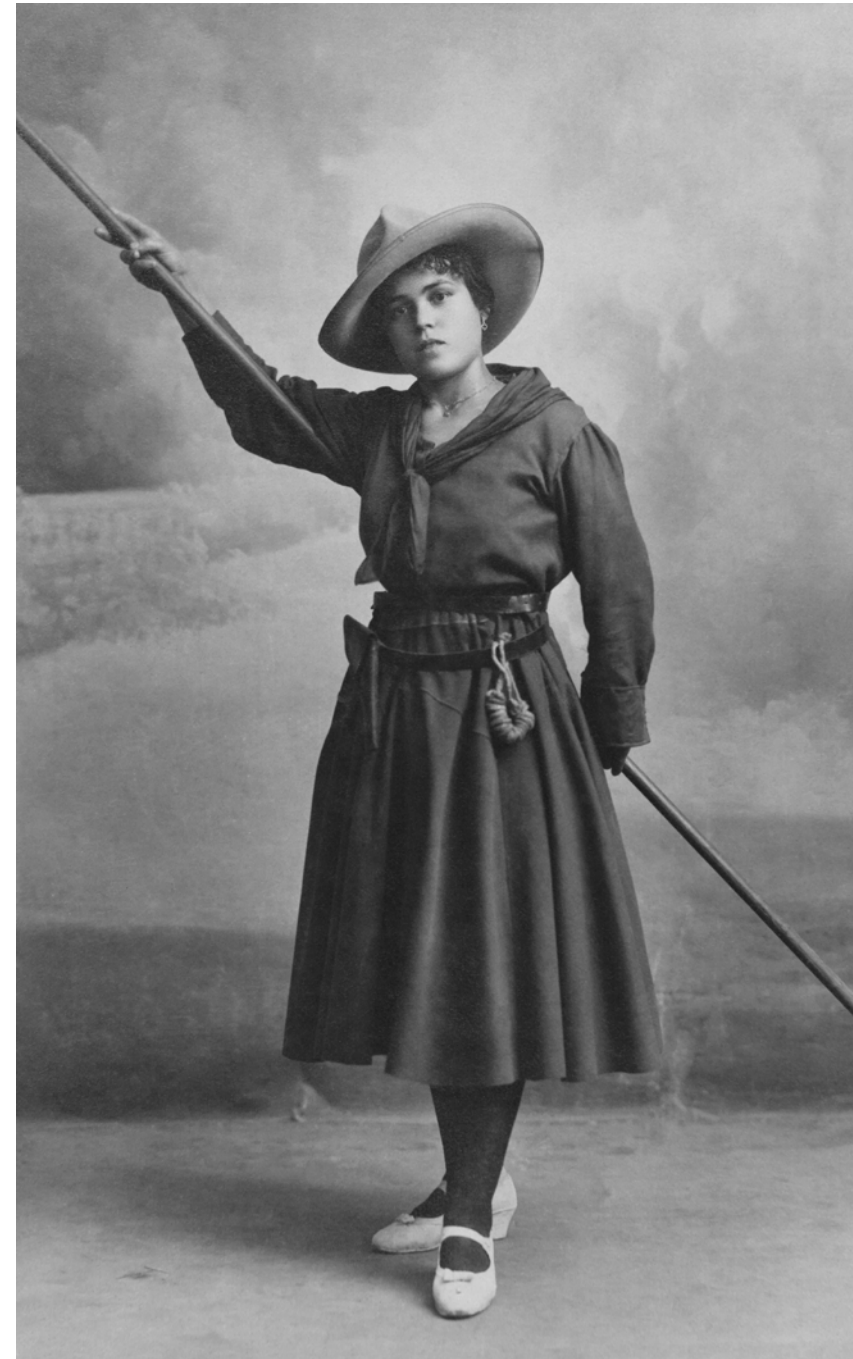
Mujer vestida de exploradora Llopis. Valencia, España. 1921