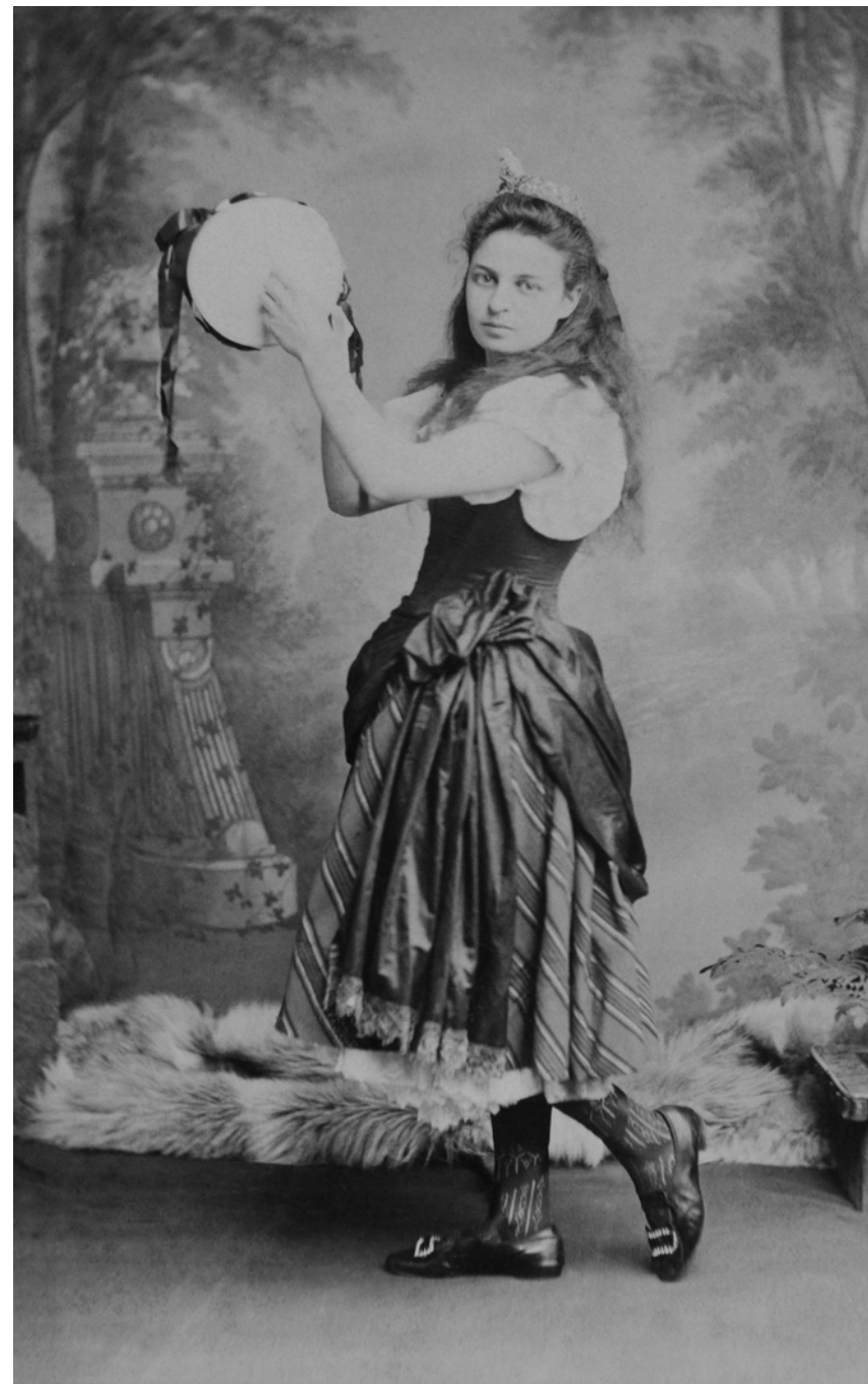
Retrato de joven disfrazada con pandereta Edward George Down. Bournemouth, Inglaterra. 1900