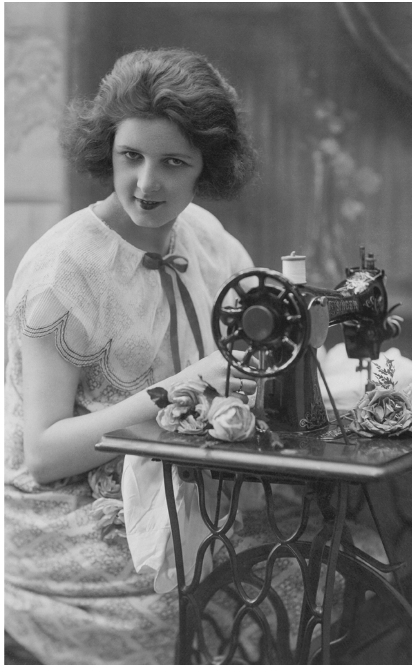
Mujer con máquina de coser París, Francia. 1926