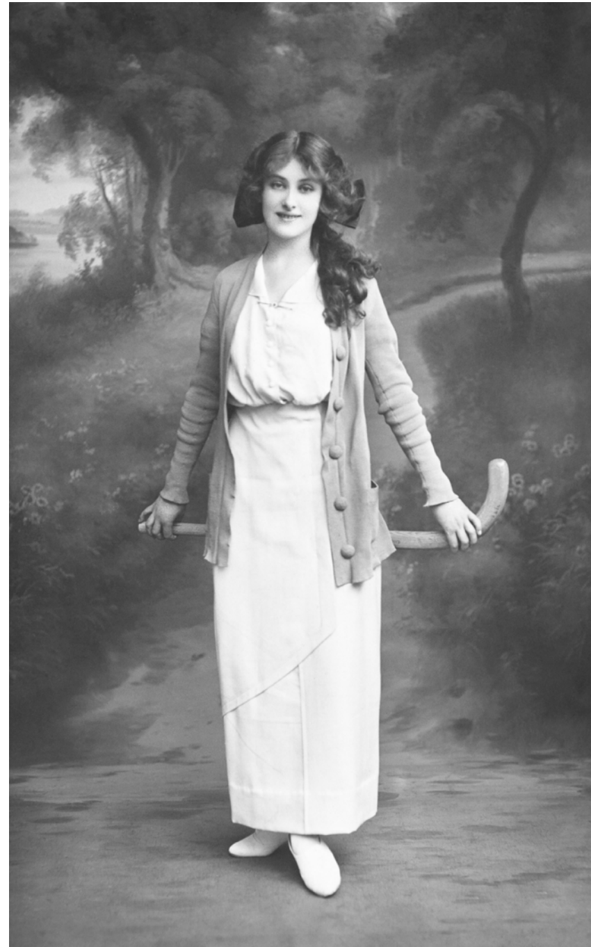
Retrato de joven con palo de hockey Londres, Inglaterra. 1915