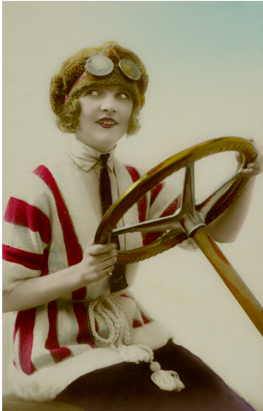
Mujer automovilista Anónima. París, Francia. 1923