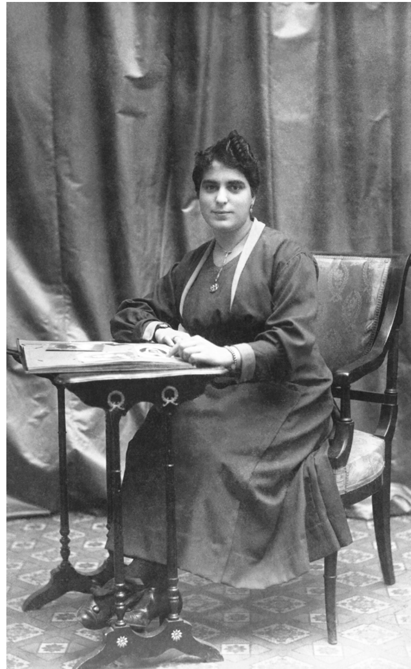
Mujer con álbum de fotografías Barrera. Sevilla, España. 1912