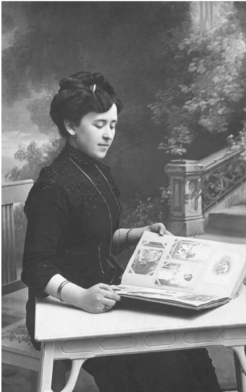
Mujer con álbum de fotografías Palomares. Córdoba, España. 1911