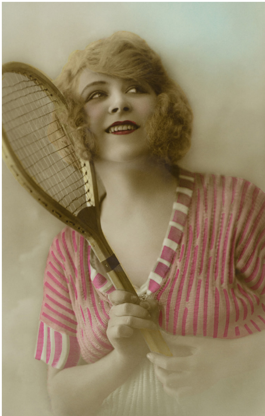
Mujer tenista Colección AN. París, Francia. 1922