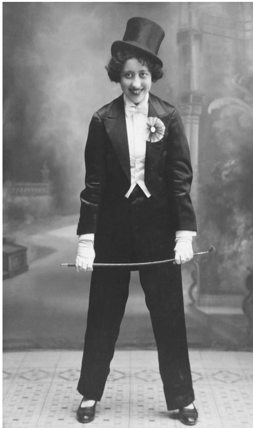
Mujer disfrazada de hombre Arenas. Málaga, España. 1911