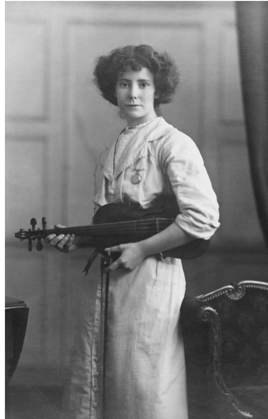
Mujer con viola C.W. Greaves Ltd. Halifax. Inglaterra. 1913