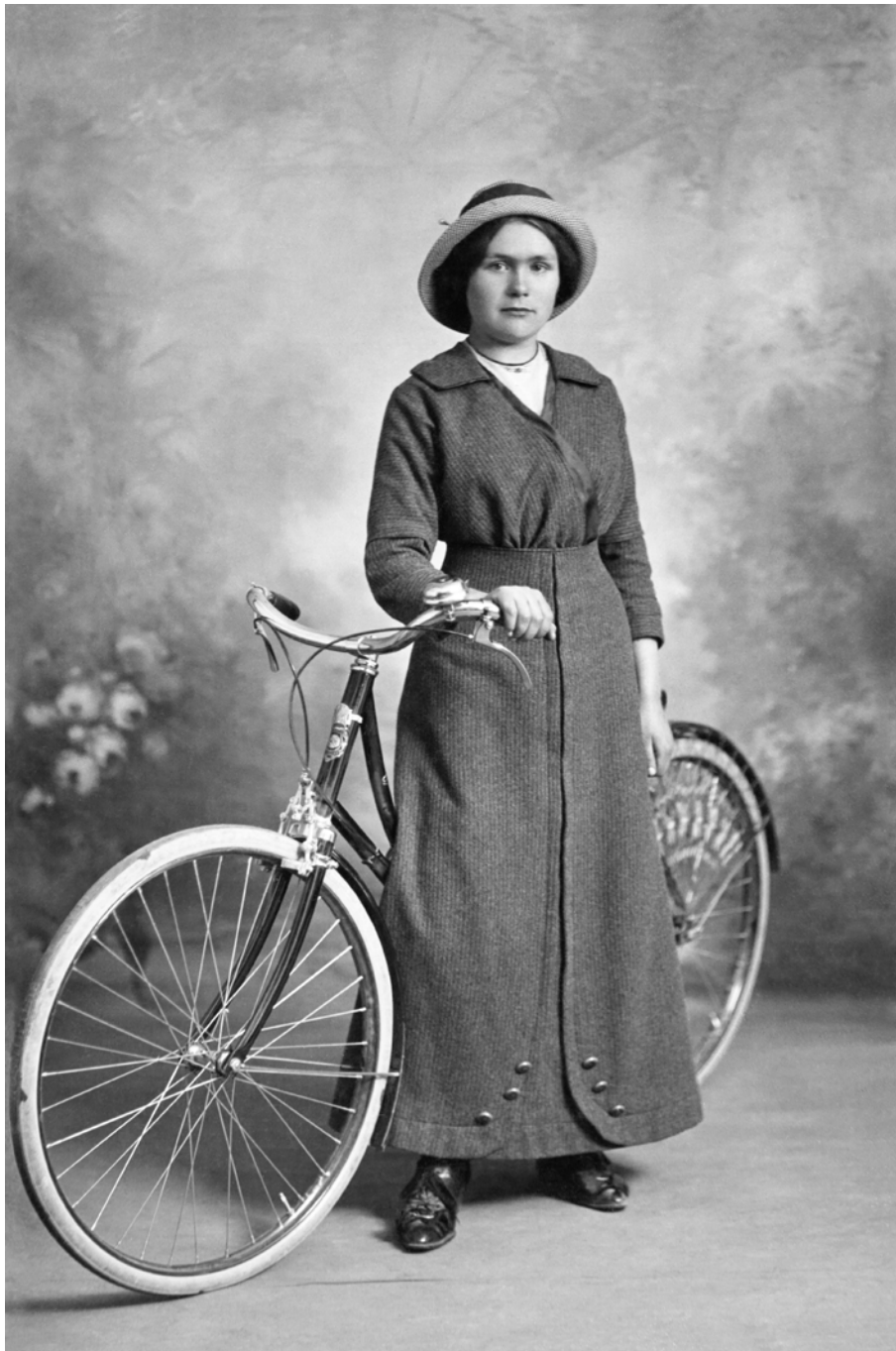
Retrato de joven con bicicleta Catelet Photographe. Beauvais, Francia. 1914