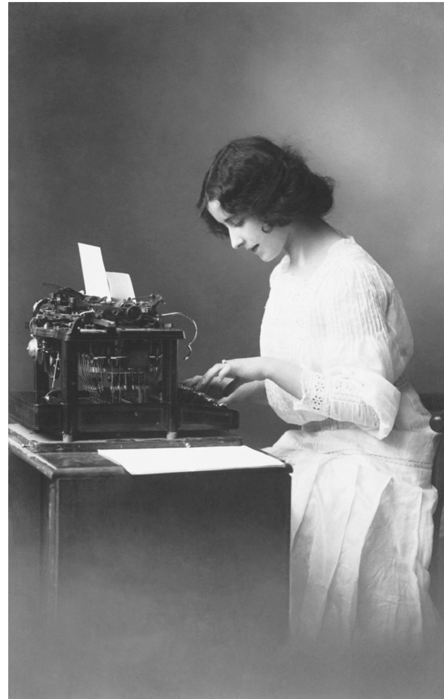
Mujer escribiendo a máquina París, Francia. 1920