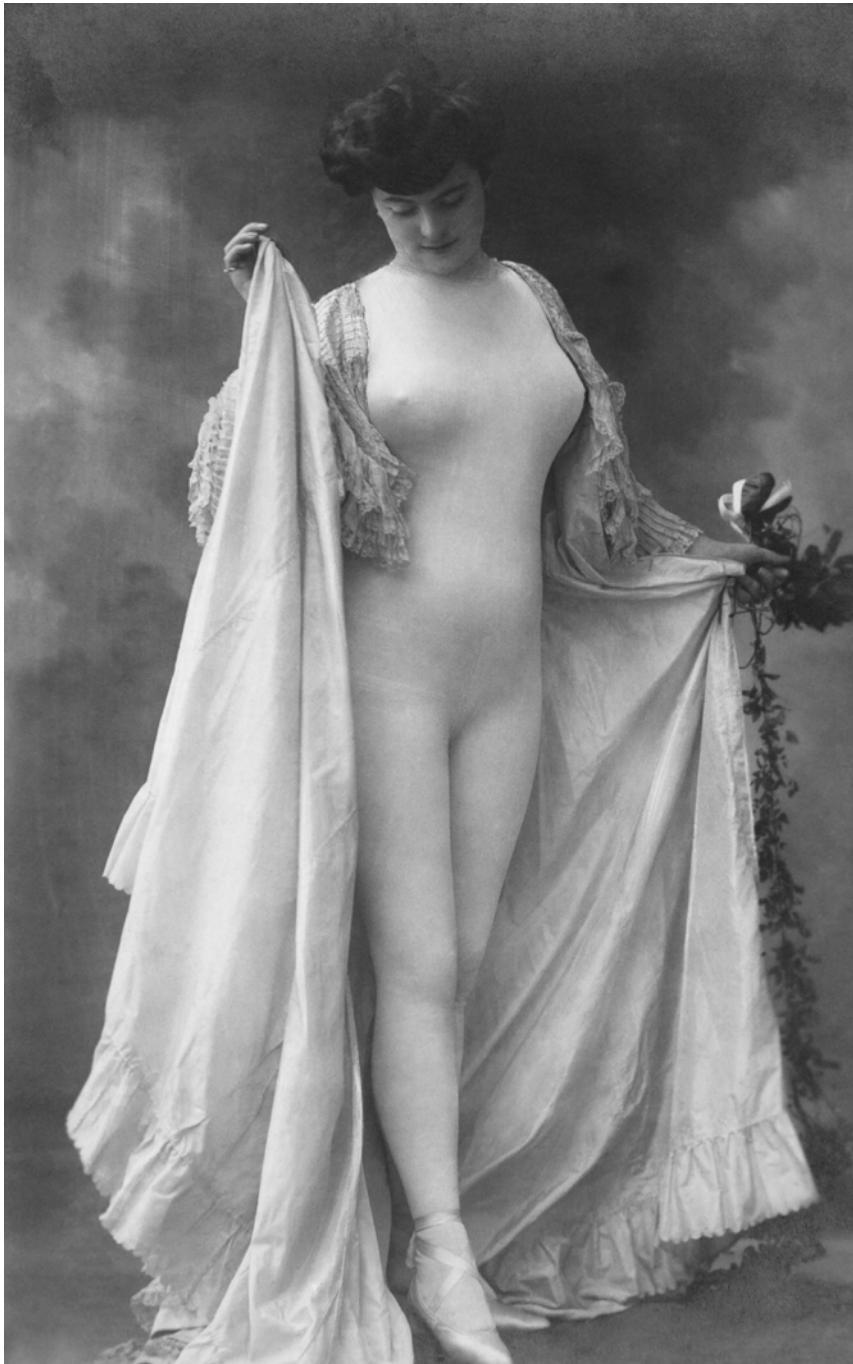
Mujer disfrazada de desnudo Anónima. Berlín, Alemania. 1910