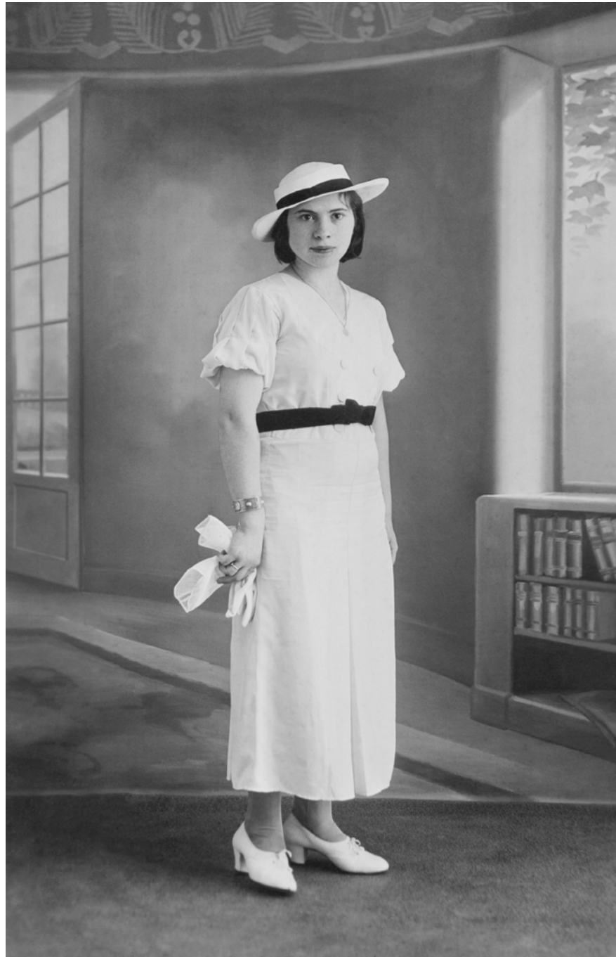
Retrato de joven en estudio Trianon Photo. Argel, Argelia. 1913