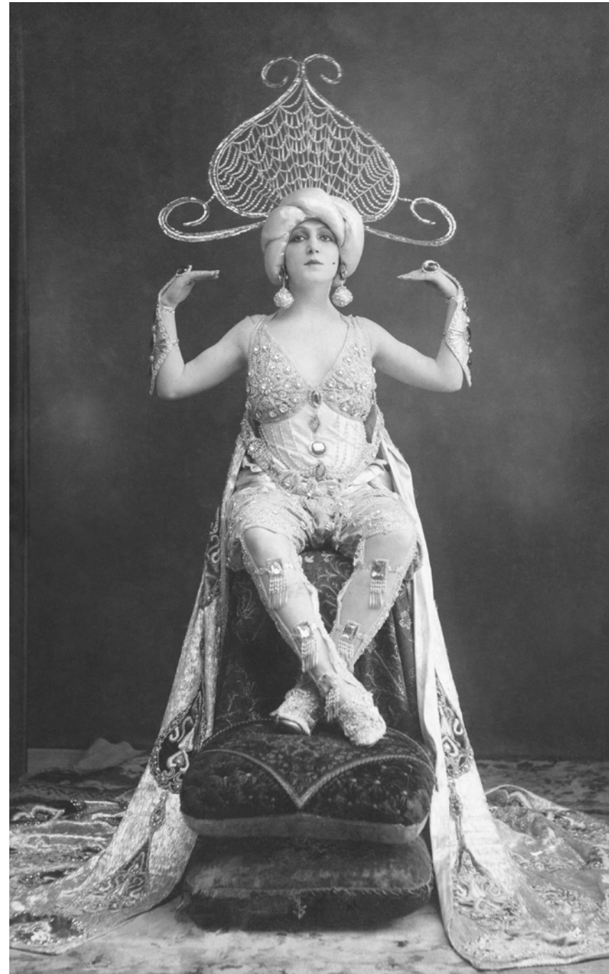
Mujer disfrazada de fantasía Esplugas. Barcelona, España. 1922