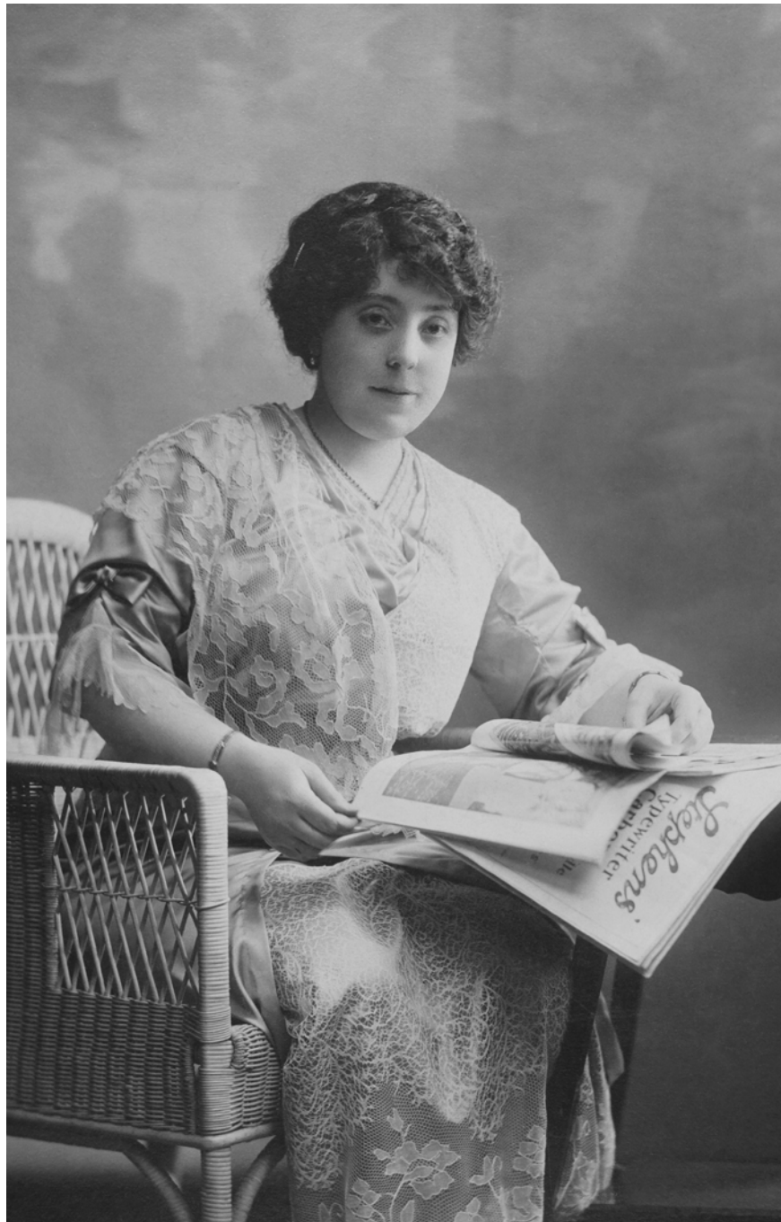
Mujer leyendo diario Kávlak. Madrid, España. 1909