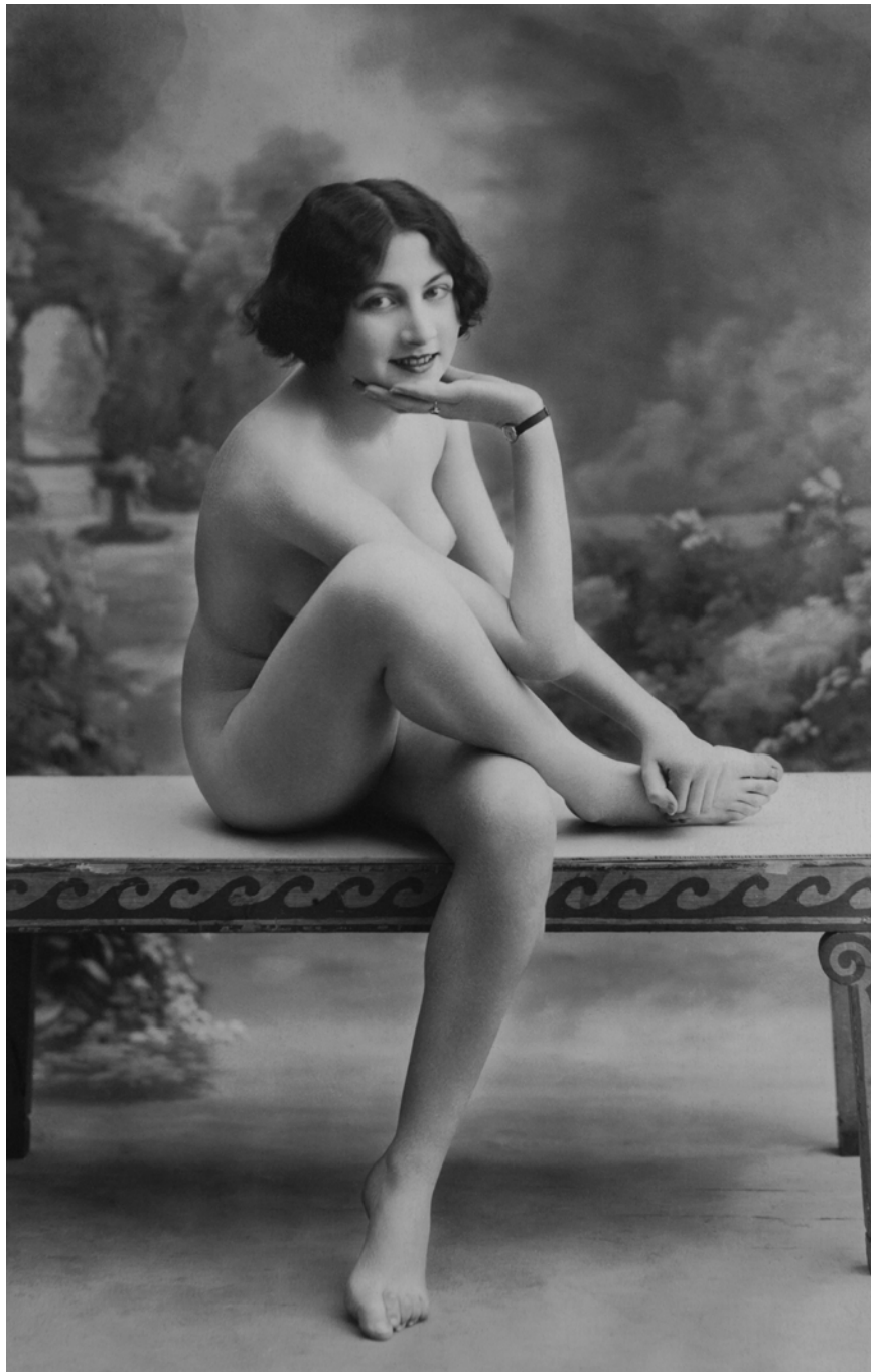
Desnudo Anónima. París, Francia. 1912