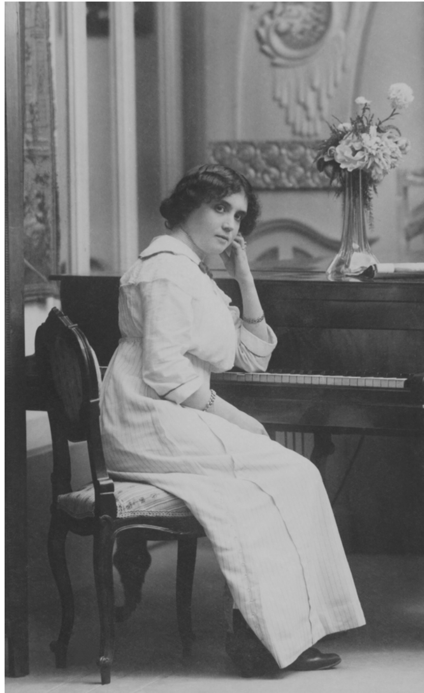
Mujer con piano Modern Styl Ernest. Barcelona, España. 1914