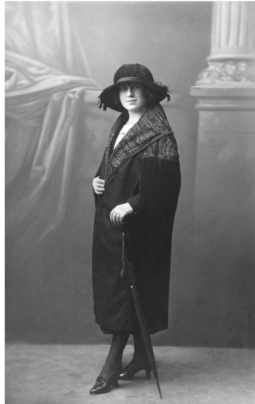
Retrato de joven con paraguas Torres. Granada, España. 1921