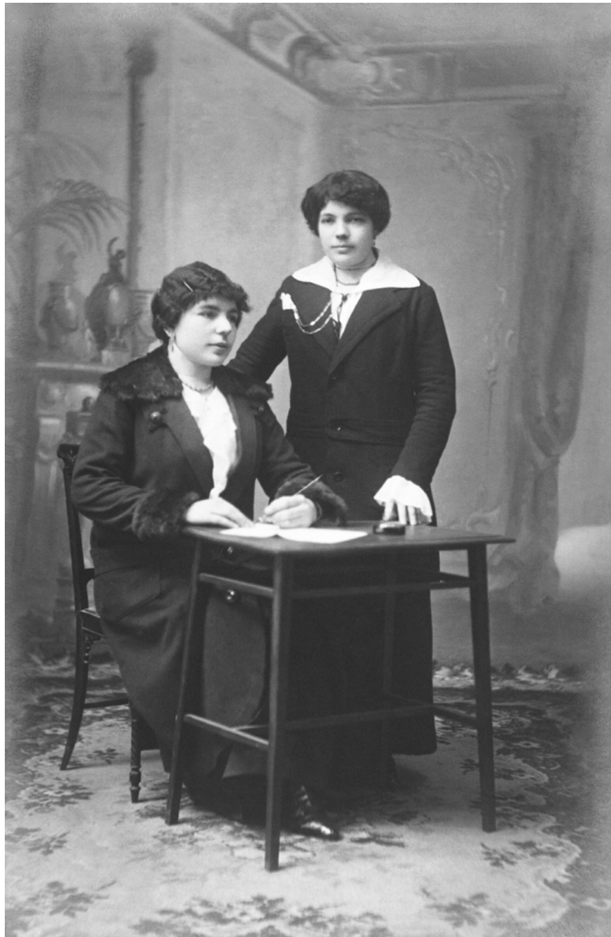
Retrato de hermanas escribiendo carta Emon. Oviedo, España. 1913