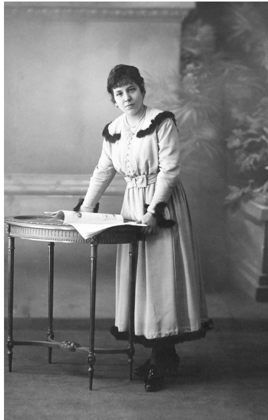
Mujer leyendo periódico Veronés. Madrid, España. 1918