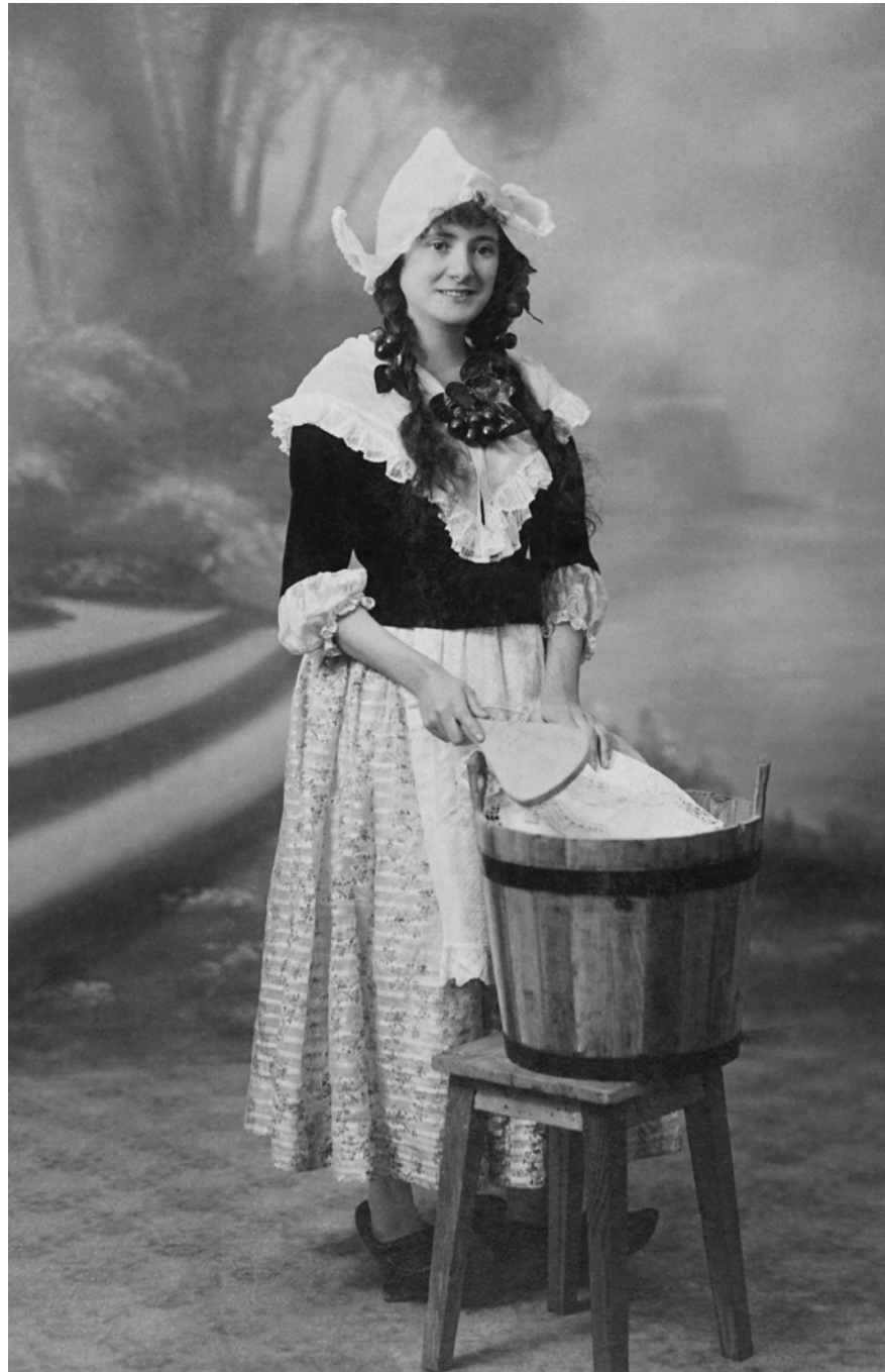
Mujer vestida de lavandera Roldán. Navarra, España. 1919