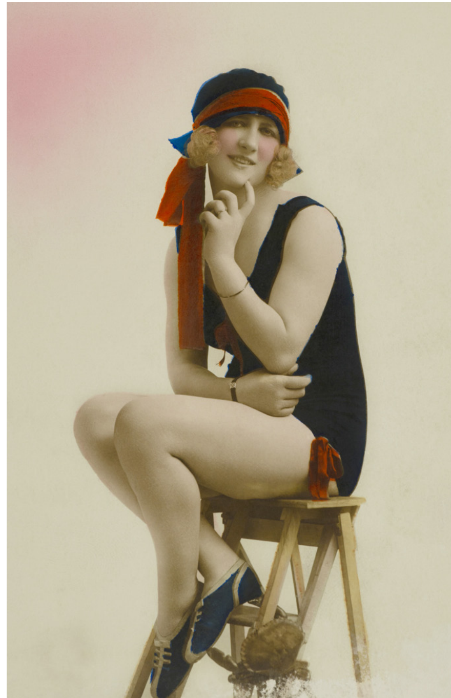
Mujer bañista París, Francia. 1916