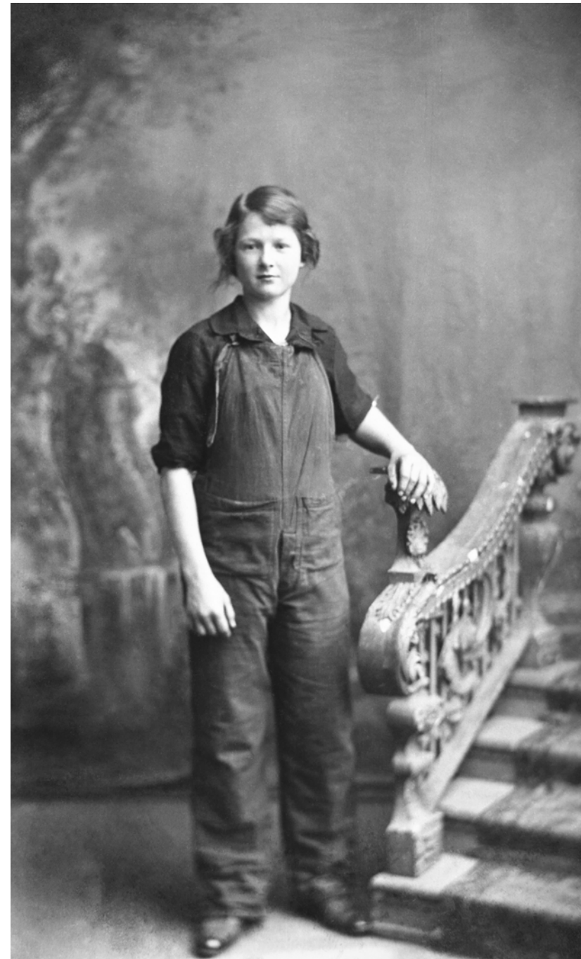
Mujer vestida de obrera de fábrica Anónima. Maidstone, Inglaterra. 1927