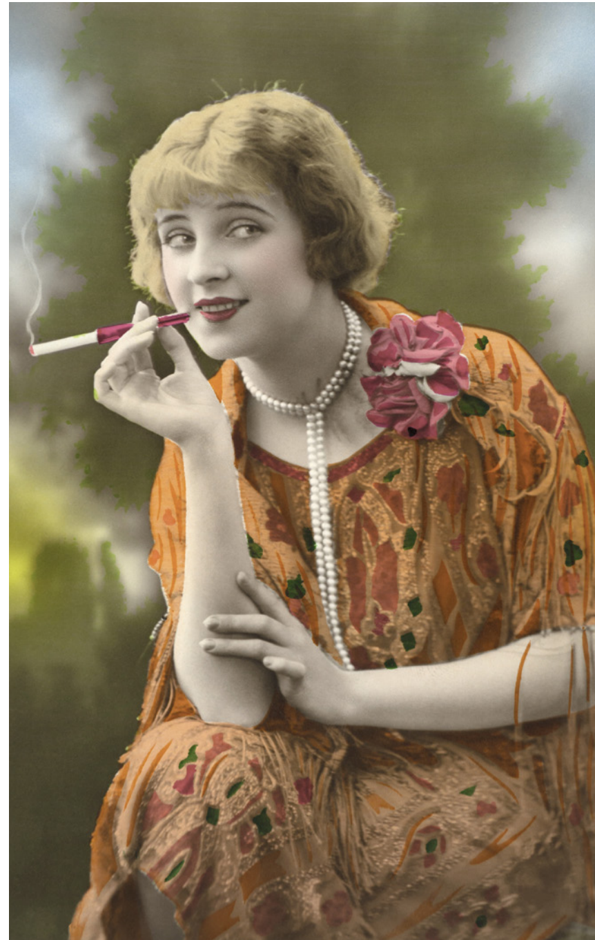
Mujer fumando Colección HM. París, Francia. 1928