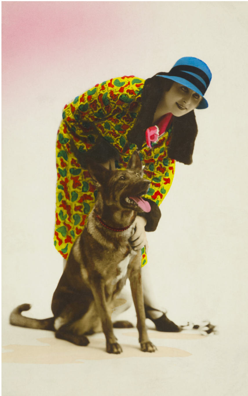
Mujer con perro París, Francia. 1920