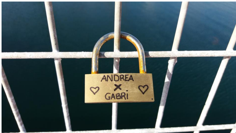
FIGURA 1. Candado de amor.

consiste en colocar candados de amor en rejas, puentes, monumentos u otros lugares públicos (Houlbrook, 2017). 4