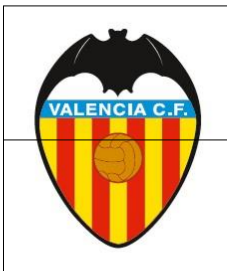
FIGURA 2. Escudo del Valencia Club de Fútbol.

La personificación o cosificación del corazón es una constante en el paisaje urbano y digital. Se vislumbran corazones en multitud de logotipos, como el del Valencia Club de Fútbol (FIGURA 2.), que incluye un murciélago, en alusión al animal que decora el escudo del equipo. Las alas del animal y el escudo forman en su conjunto un corazón. 6