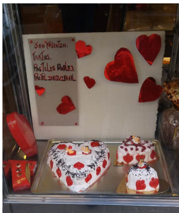
FIGURA 5. Tartas de San Valentín en forma de corazón.