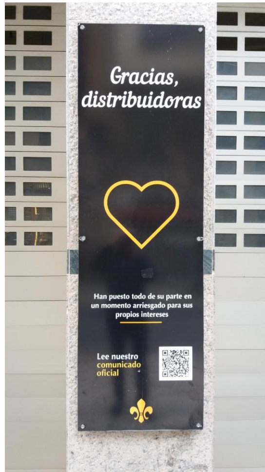
FIGURA 7. Mensaje de agradecimiento en pandemia.

Por ejemplo, en la fachada de unos cines de la ciudad de Valencia, se encontró un mensaje de agradecimiento a las distribuidoras, acompañado por un corazón, de manera muy similar a como se usa el icono en redes sociales. Este ejemplo nos muestra que no solo hay un traspaso de usos de la calle a la pantalla (expresiones de amor y amistad, uso metalingüístico), sino que también las convenciones de las redes sociales pasan a la calle (FIGURA 7.).