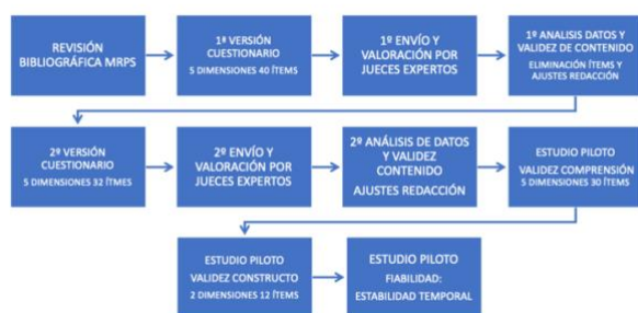
Figura 1. Fases del proceso de construcción y validación del Cuestionario ECVA-12 (Elaboración propia).

El procedimiento que se llevó a cabo incluyó las siguientes fases (figura 1):