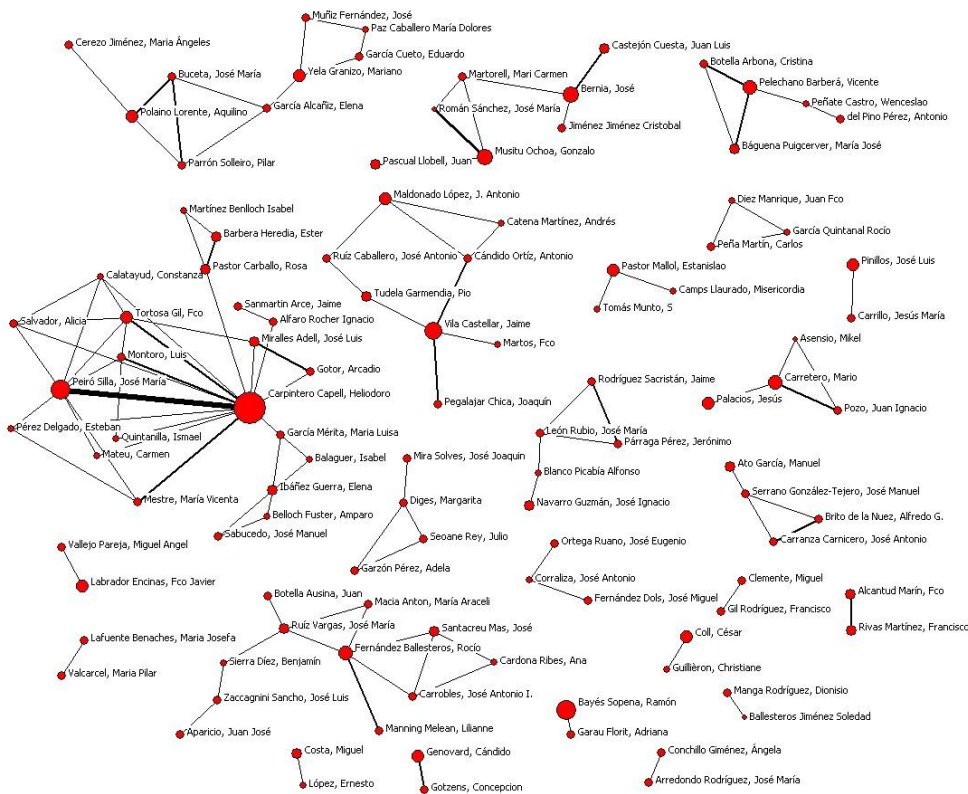
Figura 4 Red de colaboración de los autores con tres o más trabajos (1980-1984).