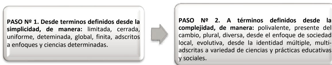
Figura 2. Evolución definiciones Educación Social