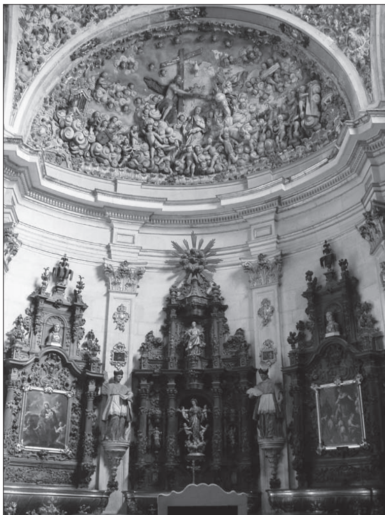
Lámina 2. Sacristía barroca de la catedral de Burgos.

inició un proceso que duraría cinco años hasta la conclusión de la tesis doctoral. En ella, el primer capítulo se dedica al análisis de la sacristía mayor, la cual constituye una de las partes más nobles del edificio eclesiástico en general y del catedralicio en particular. Allí se prepara todo lo que concierne al acto litúrgico, desde los diversos elementos que componen su rico y abundante ajuar, hasta los vestidos de los ofician-tes, los libros, velas, etc. En una primera parte teórica se atiende a diversos aspectos como la etimología de su denominación, su evolución a través de distintos periodos históricos, su ubicación en el conjunto de la catedral, los diferentes tipos existentes,