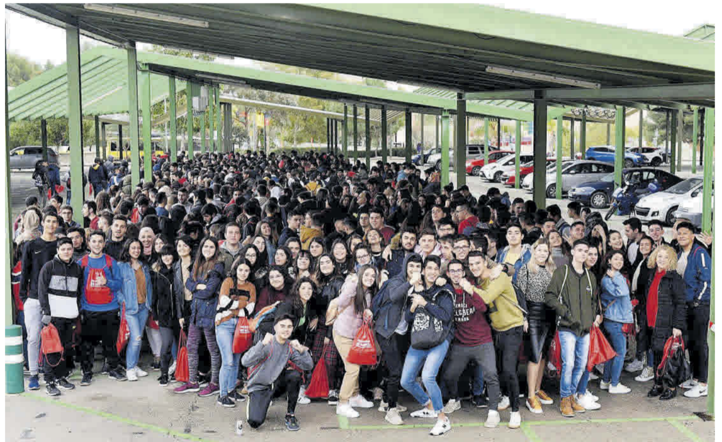
Visita guiada a la Universidad de Murcia el curso anterior.

La Universidad de Murcia pone a disposición de los estudiantes de secundaria este portal web, con presencia en RRSS, con el objetivo de hacerles más fácil la transición hacia los estudios universitarios