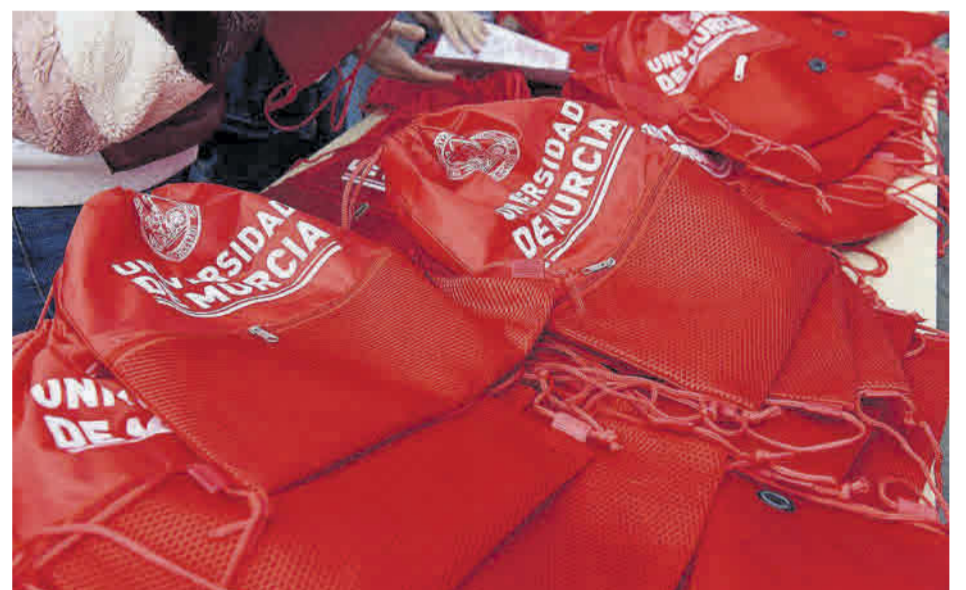
Mochilas dadas durante las visitas guiadas a la UMU.