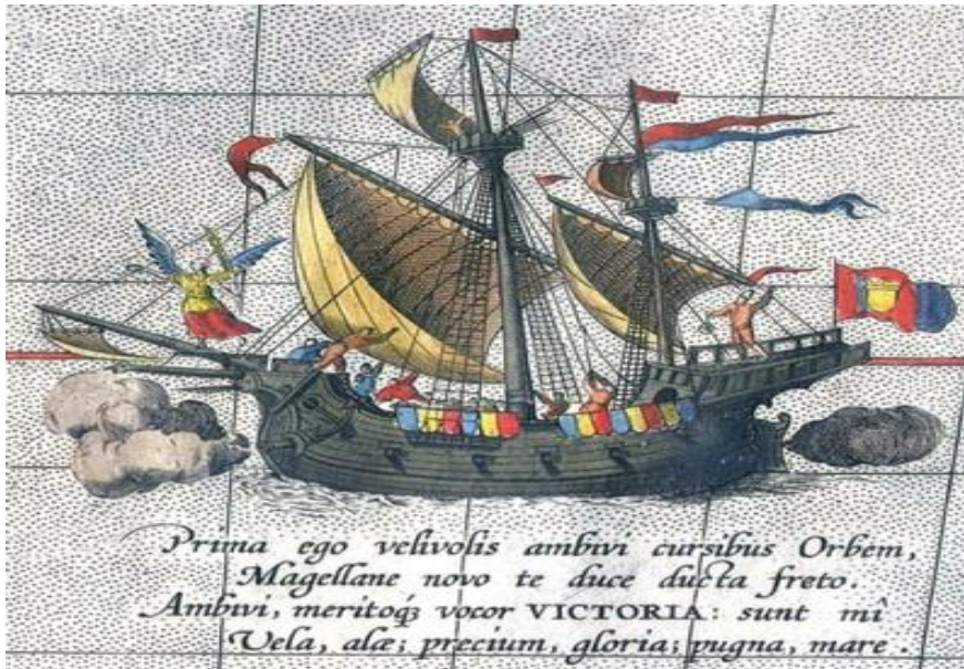
Fig. 3: Nao Victoria. Fuente: Abraham Ortelius, Theatrum Orbis Terrarum , Amberes, 1589.

Quizás el poema que más influyó en el imaginario colectivo en la posteridad es el tetrástico –de autor desconocido– que el geógrafo y cartógrafo Abraham Ortelius incluyó en el célebre mapa del Océano Pacífico o Mar del Sur que apareció en la edición de 1589 del Theatrum Orbis Terrarum 22 :