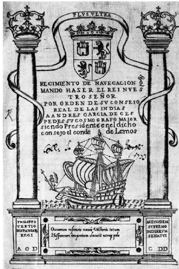
Fig. 2: Nao Victoria.

Pues bien, en la monumental portada aparecen las columnas de Hércules, arriba el escudo de la Corona de Castilla con la filacteria PLVS VLTRA ; en el campo, la Nao Victoria (reconocible por la diosa Niké sobre el bauprés a modo de mascarón) cruzando, victoriosa, por entre las legendarias columnas que simbolizan el fin del mundo conocido, y en el basamento del frontispicio podemos ver una cartela con el segundo epigrama arriba citado del Maestro López: Oceanum reserans navis Victoria totum, / Hispanum imperium clausit utroque polo 21 . Es probable que García de Céspedes tomara el dístico de los papeles que heredó de Juan López de Velasco, su antecesor en el cargo de Cosmógrafo Mayor del Consejo de Indias y con el que había colaborado desde 1577 en diversas observaciones astronómicas.