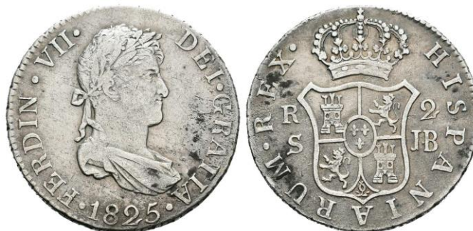
Figura 8. 2 reales Sevilla 1825. Tauler & Fau, Subasta 11, 29 de mayo de 2018, Lote 1347.

En el expediente se contiene igualmente un certificado del contador de la Casa de Moneda de Sevilla, en el que se recogen los servicios que prestó Carpio en esta ceca y las circunstancias por las que fue nombrado para la misma (figura 8):