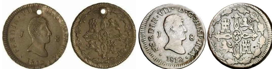
Figura 5. A izquierda, 8 maravedíes 1812. A derecha, 8 maravedíes del mismo año.