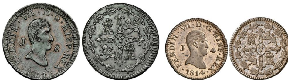
Figura 6. A la izquierda, 8 maravedíes 1814. Fuente: Jesús Vico SA, Subasta 142, 11 junio 2015, lote 506. A la derecha, 4 maravedíes de la misma fecha, Áureo & Calicó S.L., subasta 266, 12 de marzo de 2015, lote 277.

Según Fontecha, los tipos utilizados se ajustan a lo dispuesto por las Cortes para la moneda de oro el 2 de junio de 1811, en la que se mandaba que el busto real se pusiese al natural o en desnudo, y no de traje o con armadura como se había venido haciendo. En las piezas labradas entre este año y 1817 aparece en su anverso el busto de Fernando VII mirando a derecha, con letra J de ceca, y delante el numeral de su valor en maravedíes. En su reverso, según lo ordenado por el Decreto de las Cortes de 11 de mayo, se incluyeron los cuatro cuarteles de Castilla y León, separados por la cruz llamada del infante don Pelayo, y en su centro escudete oval con las tres flores de lis de la Casa de Borbón, todo ello rodeado de orla de laurel 23 .