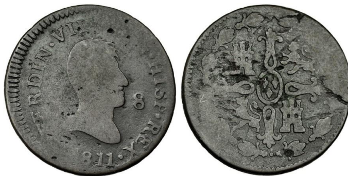
Figura 4. 8 reales Jubia 1811.

... hallándose grabador ninguno para mi gran deseo supieron de mí y me mandó llamar el Sr. Ministro que lo era el Sr Cangas y Argüelles y me animó que fuese de grabador a Galicia, a lo que contesté que cómo iba a dejar un destino como el que tenía que me valía otro tanto y matarme trabajando y me contestó que era preciso lo hiciera, pues iba a hacer un gran servicio y que el Gobierno me lo sabría pagar: en efecto lo admití y el resultado ha sido haberme matado trabajando y haber perdido la salud y haber tenido que jubilarme con cuatro mil reales: no quiero molestar mucho a VS por los servicios que he hecho en esta Casa de Moneda necesitaba un pliego o estar yo presente para explicarlo, y se complacería VS de este pobre anciano con 75 años de edad y cargado de familia. Es cuanto puede decir con arreglo a lo que se me exija. Sevilla 21 de junio 1828.