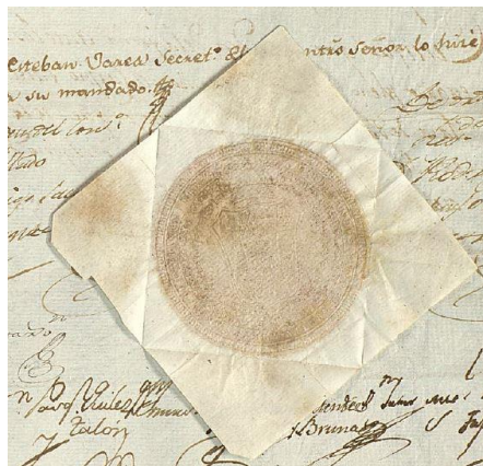
Figura 3. Sello de la Real Cédula de su nombramiento como Portero de Cámara.